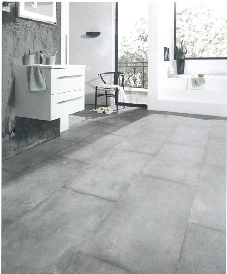
Die Objektversiegelung von Java garantiert die Beanspruchungsklasse 33, ein Abriebverhalten AC5 sowie eine hohe Chemikalien- und auch Urinbeständigkeit. Java Artbeton Grigio

Der mineralische Designboden Java spielt laut Hersteller KWG insbesondere in der Renovierung von Bad- und Wellnessbereichen seine vielen Vorteile aus. Die schwimmende Verlegung mittels Unilin-Verlegesystem