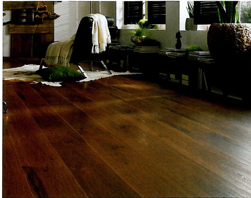
Infinity Extend, Dekor Cognaceiche, punktet mit natürlicher Optik und großen Formaten.